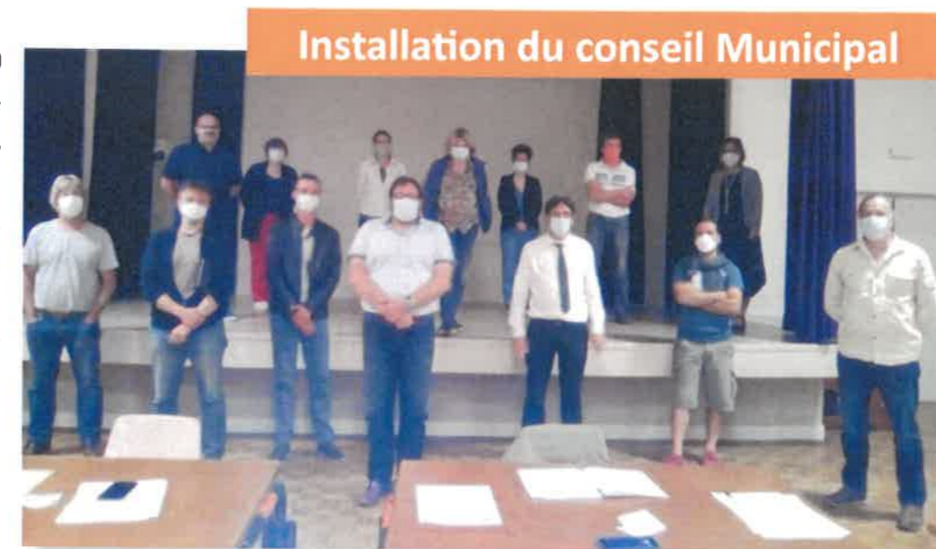
Sur la photo manque Valérie Bruneau

Le 25 Mai 2020 à la salle polyvalente en respectant les consignes sanitaires, l'ensemble des élus du 15 mars, ont pu prendre leurs fonctions et désigner le Maire et les trois adjoints.