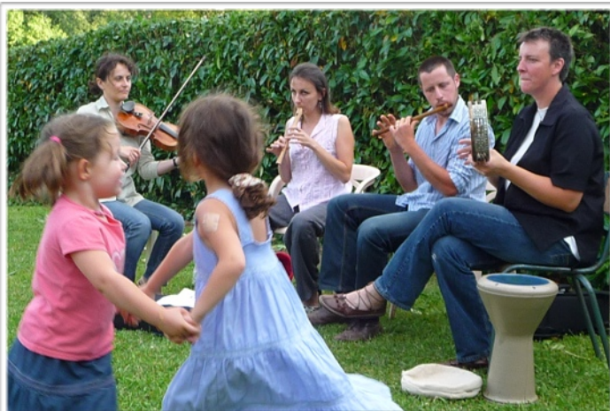
Soirée musique de chambre

«Les Passeurs d'Histoires». Elle se poursuivra en 2011 avec de nouveaux lieux et de nouveaux contes thématiques. Le prochain sera à la Bibliothèque en février 2011.