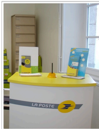
La poste de St Priest Ligoure