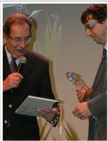
Remise du 1 er prix des rubans verts catégorie collectivités locales

Pour plus d'informations: http://www.tourisme-hautevienne.com/IMG/pdf/livret_palmares_fleurissement.pdf