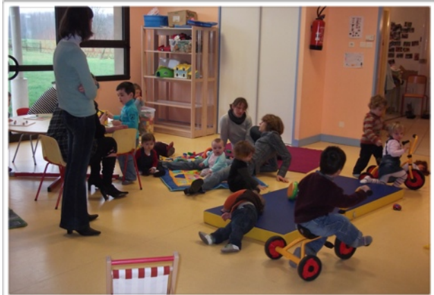
Séance de jeux collectifs organisés par le R.A.M.