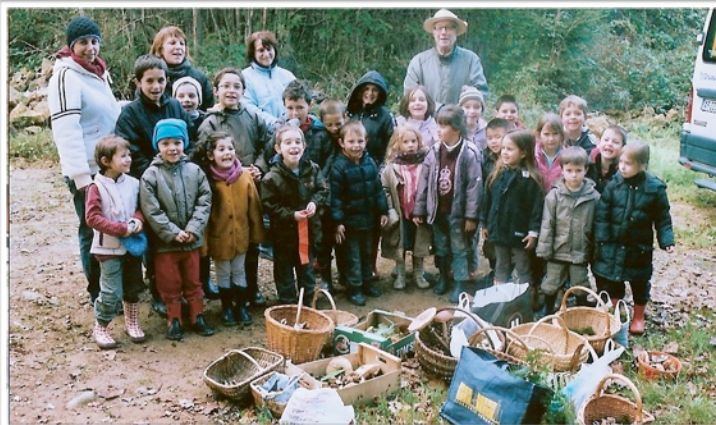
A la découverte des champignons