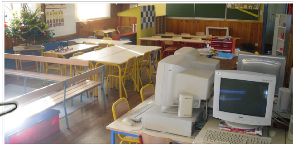
Classe de Mme DURIEUX