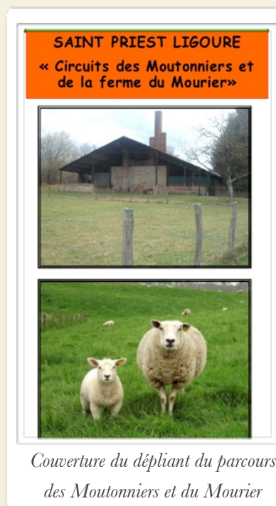
Couverture du dépliant du parcours des Moutonniers et du Mourier

Le site internet de notre commune soera bientôt terminé. La maquette du site est réalisée sur Rapidweaver, mais sera modulable en fonction de vos remarques future