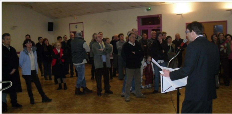
Présentation des vœux par Mr le Maire