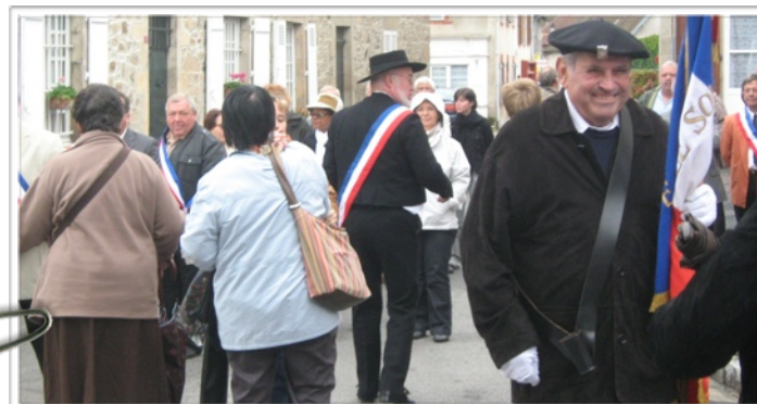
Dépôt de gerbes au monument aux morts

Les Etats doivent réduire leur dépense, la croissance étant faible, ce sont les budgets d'investissement