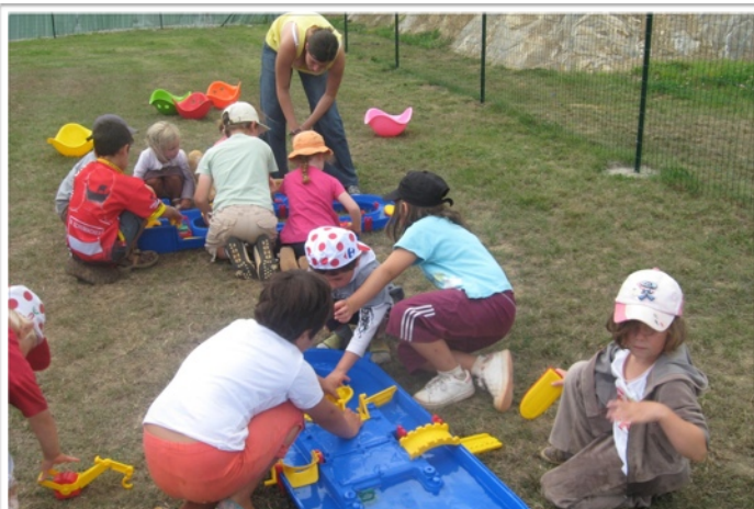
Animation enfant, La Roulotte

La Roulotte est une ludothèque ambulante, qui s'est donné pour mission d'amener le Jeu auprès d'un maximum de publics,