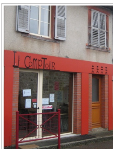
Le comptoir, le lieu....