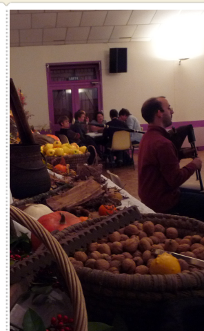
Soirée châtaigne et jeux