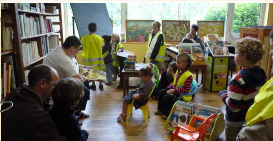
Première fête de l'été, lecture de contes aux enfants dans la bibliothèque