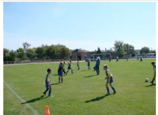
Rhonus tempor placerat.

Les entraînements ont lieu le mardi soir pour les débutants, poussins et benjamins et le mercredi