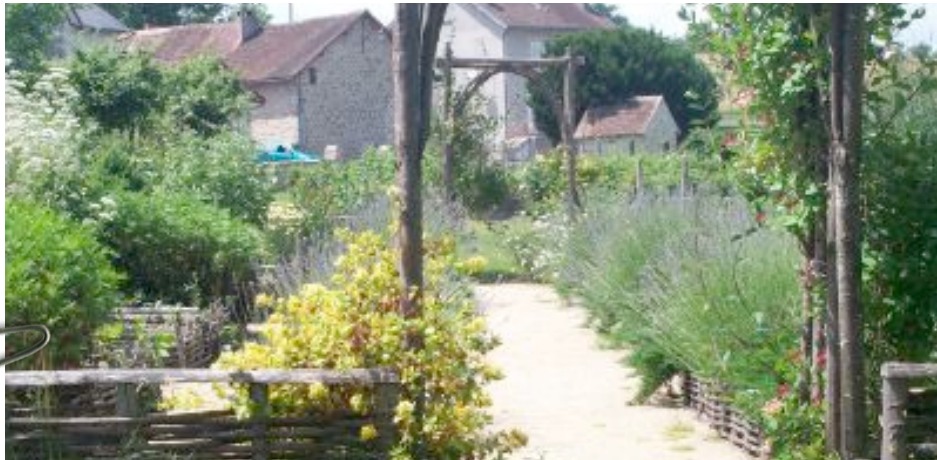
Le jardin médiéval de Rihlac Lastour