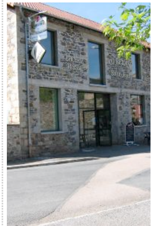
Multiscommerce de St Jean Ligoure

Dans cette partie nous vous proposons de découvrir des informations liées aux fonctionnements et aux réalisations de la communauté de commune du Pays de Nexon, ainsi que des structures de type syndicat qui nous aident à gérer collectivement certaines activités indispensables au bien être de chaque citoyen de notre commune.