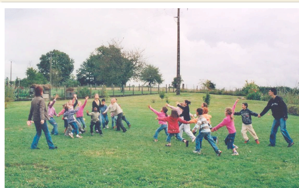
Jeux de balles au terrier des Galoupiaux

L'inscription se fait au trimestre. Si vous êtes intéressés, vous pouvez prendre contact avec Sandrine Dutaud au 0555 58 11 05