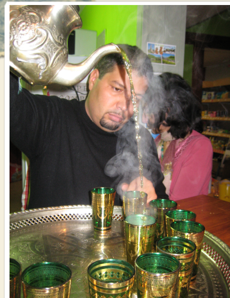
Soirée marocaine le .....

L'ouverture le dimanche matin de 10h à 13h symbolise presque à elle seule l'esprit du « Comptoir ». Une solidarité et une convivialité