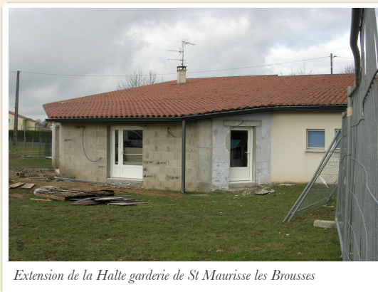
Extension de la Halte garderie de St Maurice les Brousses

« le terrier des situé à Janailhac est également très positif, tant sur le plan de la fréquentation (172 enfants accueillis cet été), qu'au niveau de la satisfaction des familles.