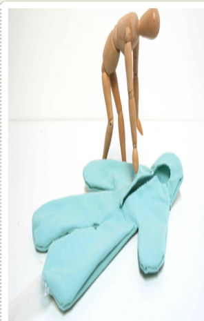
Kristina DePaulis., Mets-ta mémoire

Faire vivre un village c'est pour l'équipe municipale créer du lien, de l'activité économique et/ou artistique. Nos désirs ont été pour partie comblés cette année puisque nous avons eu la chance de voir s'installer le comptoir , petit multi-service, que nous avons souhaité et que nous soutenons financièrement. Cette nouvelle activité économique au centre bourg est complétée par une activité libérale depuis plus d'un an maintenant par un cabinet d' acupuncture , et par l'installation d'une plasticienne sculpteur .