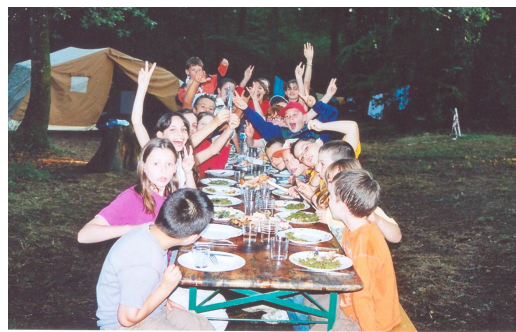
Le camping ...

- Permettre aux enfants issus du milieu rural de participer à des activités habituellement réservées aux "citadins", qu'elles soient sportives ou culturelles.