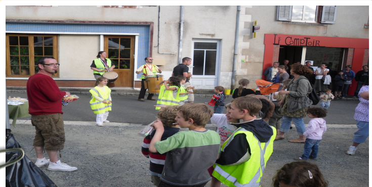
Fête de l'été 2009

Après deux consultations, la réfection de la toiture des écoles est commencée et sera réalisée par l'entreprise