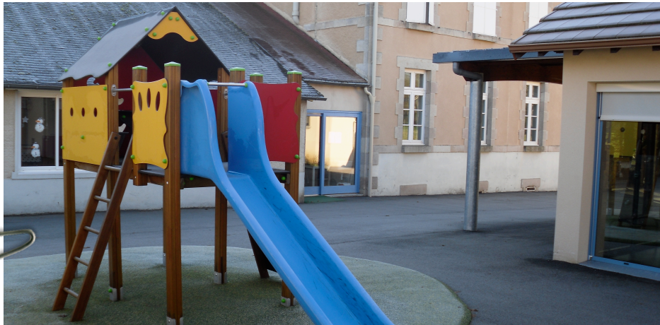
Aire de jeux de la cours de l'école de St Priest Ligoure