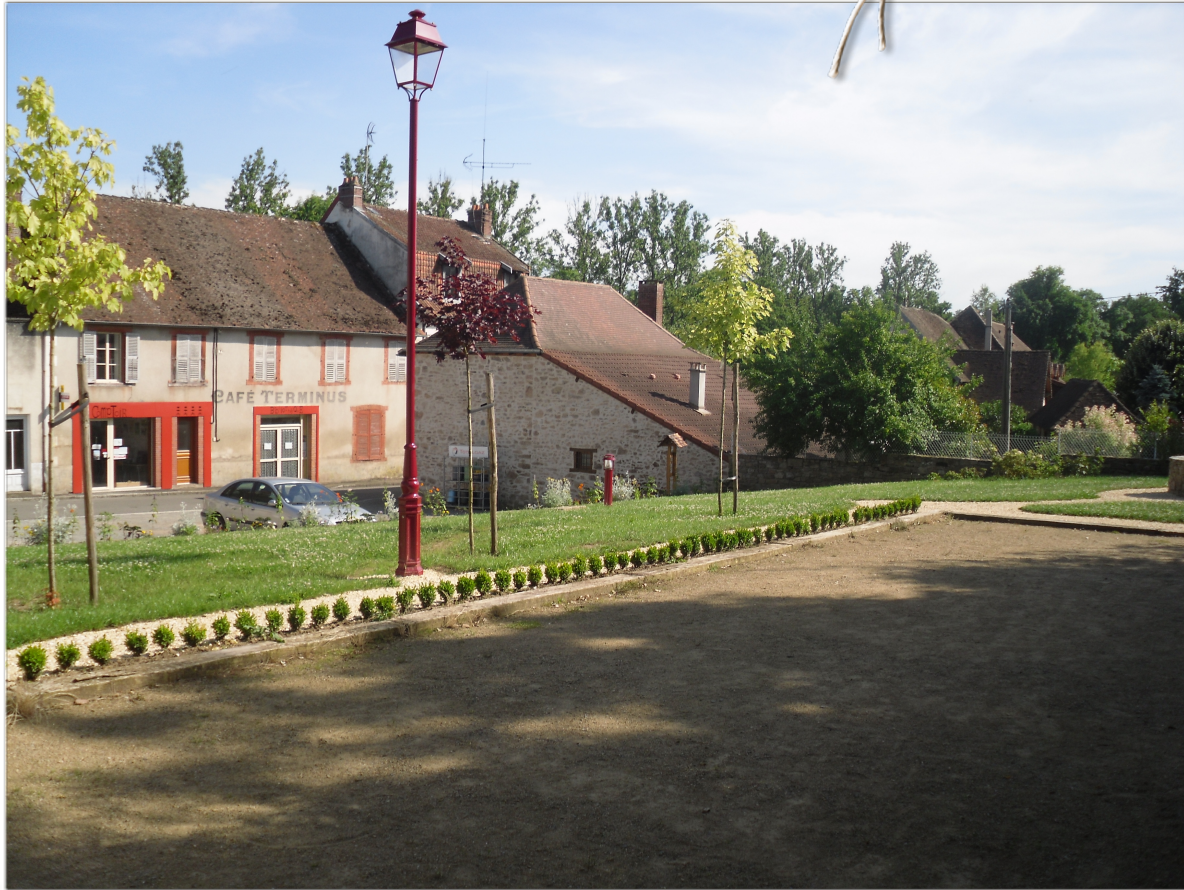
Square des LEMOVICES