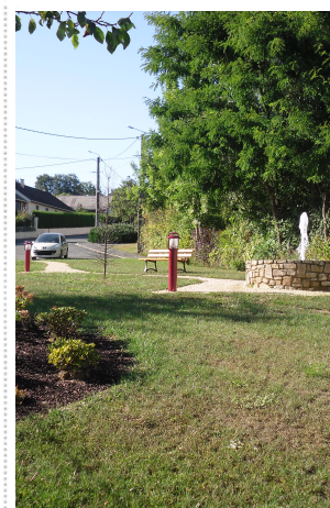
Fête de l'été