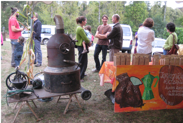
Rencontre avec les producteurs le .....